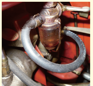
樹脂製品部分の劣化 燃料ホースの劣化による 燃料にじみ、もれ

きちんと保管してあるからといって、安心してはいけません。 老朽化した可搬消防ポンプには、多くの危険がひそんでいます。