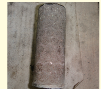
真空ポンプストレーナー ゴミ詰まりによる吸水不能