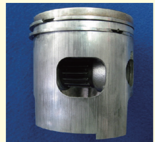
オイル不良 ピストンの異常磨耗 (全周に縦キズあり)